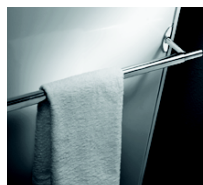
Verti M Piano handdoekbeugel als optie verkrijgbaar