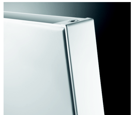
Verti M Piano